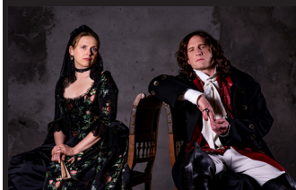
LE CHEVALIER ET LA DAME