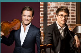
RENAUD CAPUÇON ET GUILLAUME BELLOM